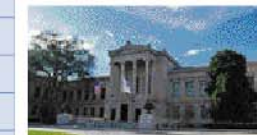
ポストンミュージアム