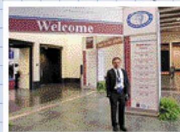
第14回世界脳神経外科学会の会場前にて

ポストンはマサチューセッツ州、ワシントンDCはアメリカの首都で50州のどこにも属さない都市です。