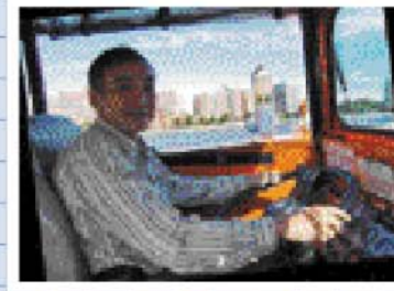
ポストン・ダックツアーに参加 水陸両用の車両で市内観光