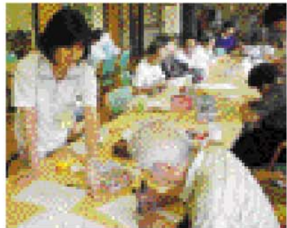
▼しじみ貝で作った根付け

アイアイルームでは通常のリハビリに加え、折り紙などを用いた色々な手作業も行っています。手に取ったものが少しずつ形となり作品となった時、皆さんの笑顔は私にとって格別の喜びとなります。明日の笑顔を想像しつつ、しじみ貝の根付け作りを楽しむ毎日です。