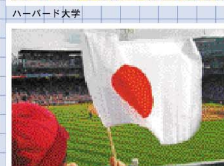
フェンウェイ・スタジアム 地元ポストン・レッドソックス対トロント・ブルージェイズ (最終回に斉藤隆投手が登場。)