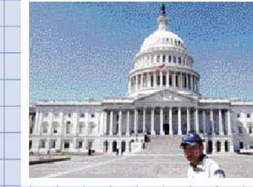
国会議事堂前にて