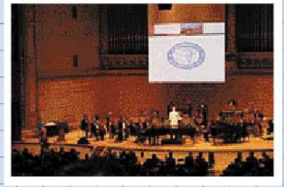
小澤征爾が活躍したポストンシンフォニーホール