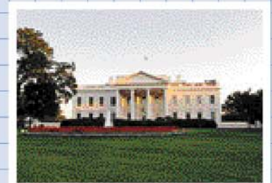
ホワイトハウス(ワシントンDC)